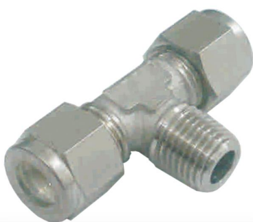
TEE MACHO CENTRAL T-TMCT