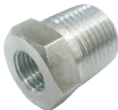
BUCHA REDUTORA MACHO FÊMEA -BRMF-