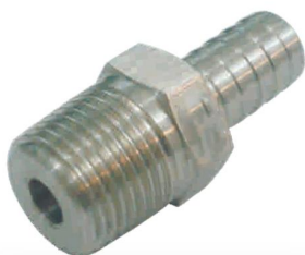
BICO DE MANGUEIRA MACHO -BMM-