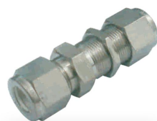
UNIÃO BULKHEAD -UB-