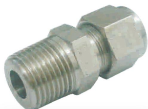
CONECTOR MACHO -CM-