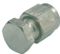
TAMPÃO PARA TUBO -TPT-