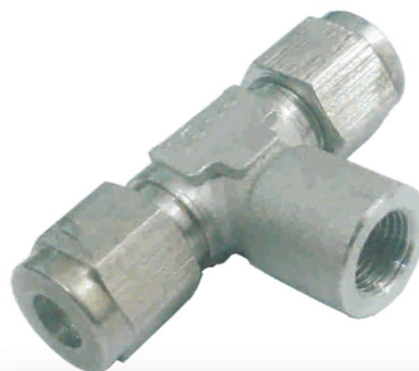
TEE FÊMEA CENTRAL T-TFCT