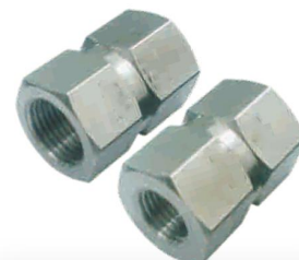
UNIÃO REDUTORA FÊMEA -URF-