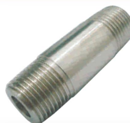
NIPLE REDONDO -NR-