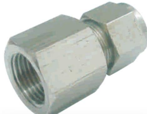
CONECTOR FÊMEA -CF-