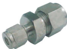
UNIÃO REDUTORA -UR-