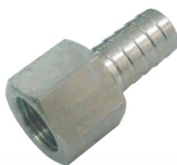
BICO DE MANGUEIRA FÊMEA -BMF-