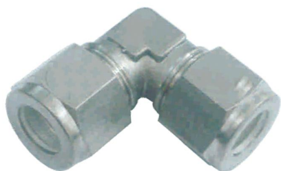
COTOVELO UNIÃO C-U