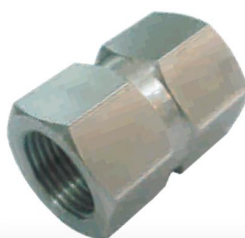
UNIÃO FÊMEA -UF-