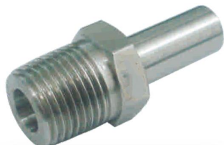
ADAPTADOR MACHO -TM-