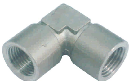
COTOVELO FÊMEA C-MF