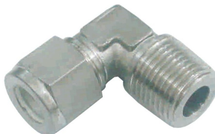
COTOVELO TUBO MACHO C-TM