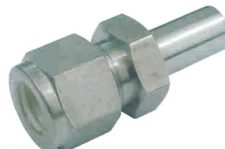
ADAPTADOR PARA TUBO -TT-