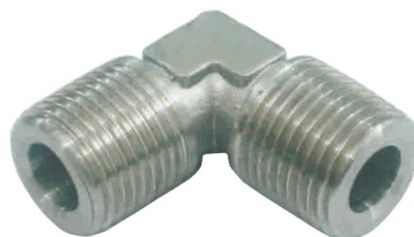
COTOVELO MACHO C-M