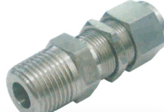
CONECTOR BULKHEAD MACHO -CBM-