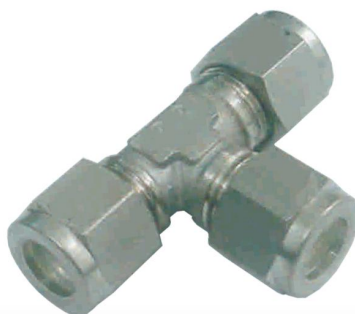
TEE UNIÃO T-U