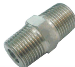
NIPLE SEXTAVADO -NS-