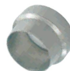
ANILHA DIANTEIRA -AD-