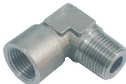
COTOVELO MACHO FÊMEA C-MF