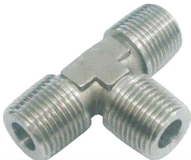
TEE MACHO T-M