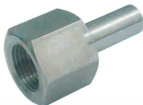
ADAPTADOR FÊMEA -TF-