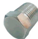
TAMPÃO MACHO -TPM-