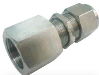
CONECTOR BULKHEAD FÊMEA -CBF-