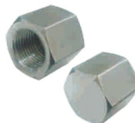
TAMPÃO FÊMEA -TPF-