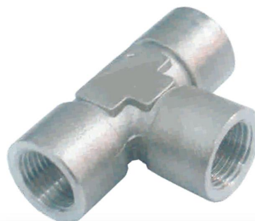
TEE FÊMEA T-F