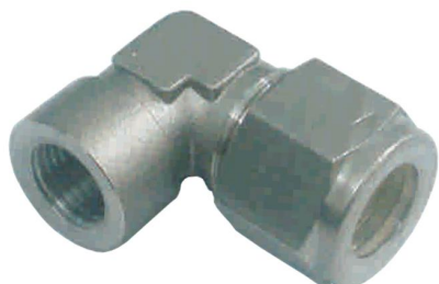
COTOVELO TUBO FÊMEA C-TF