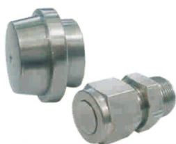
TAMPÃO PARA CONEXÃO -TPC-