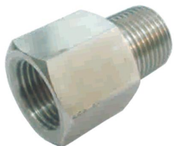
UNIÃO MACHO FÊMEA -UMF-